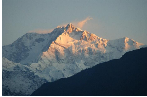
Darjeeling (Kanchejunga 8,586m)

Darjeeling "De höga kullarnas juvel" ligger i nordöstra hörnet av Västbengalen och distriktet gränsar till Sikkim. Här vid Himalayas fot produceras världens bästa tesorter på odlingar upp till 2 500 meter över havet. Det lokala teet här kallas för "Teernas Champagne" och anses som det bästa teet i världen.