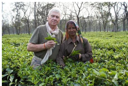
Temi - Tea garden Sikkim

Här finns en rik och varierad flora och fauna från tropiskt till alpint, bland annat finns 550 arter orkidéer, 36 typer rhododendron, 26 bambusorter och 425 typer av olika medicinska plantor. I faunan finns 552 arter fåglar, 690 arter fjärilar och 48 fisksorter. Bland de mer sällsynta vilda djuren finns snöleopard, trädleopard och tibetansk brunbjörn