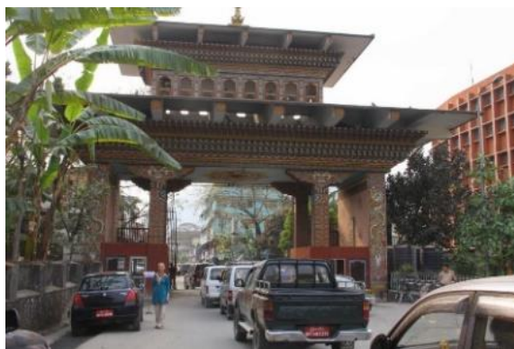
Gränsportalen Indien/Bhutan i Jaigaon