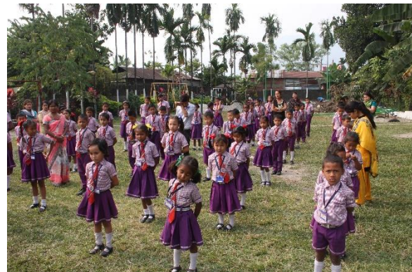
Elever på skolan Kjell Borneland Academy