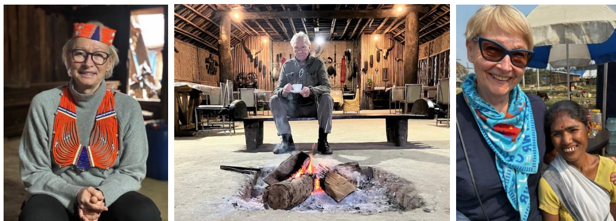
Nagaland februari 2026

ÖVERNATTNING AGMAN HELSA MORUNG RETRAT, MON