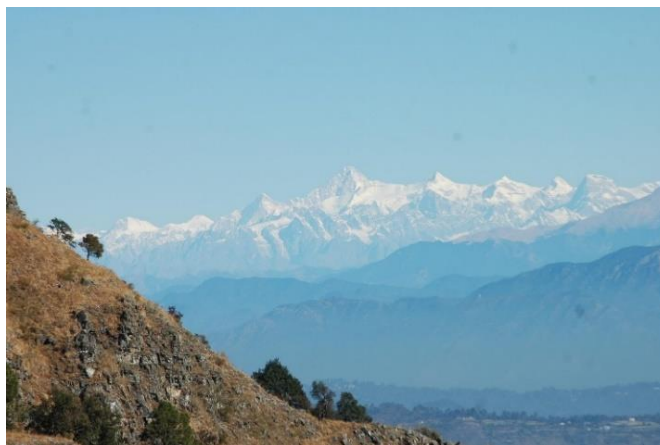
Vy utmed Himalayas sluttningar (Nainital)