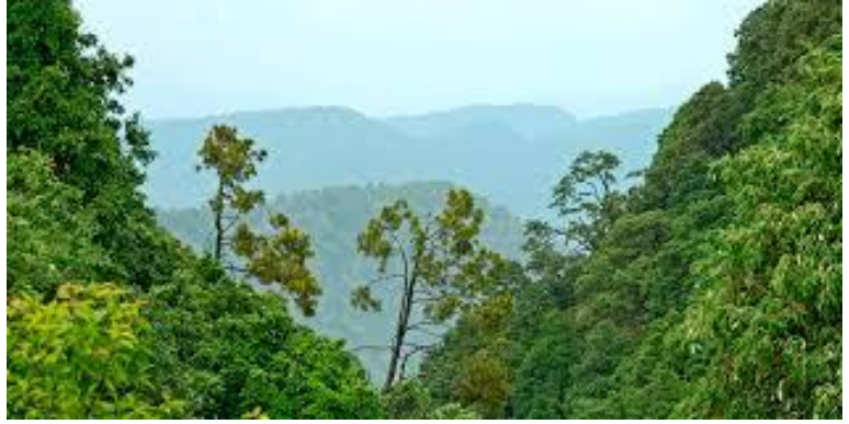
Himalayas grönklädda berg (Uttarakhand)