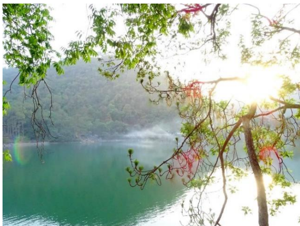
Sat Tal Lake