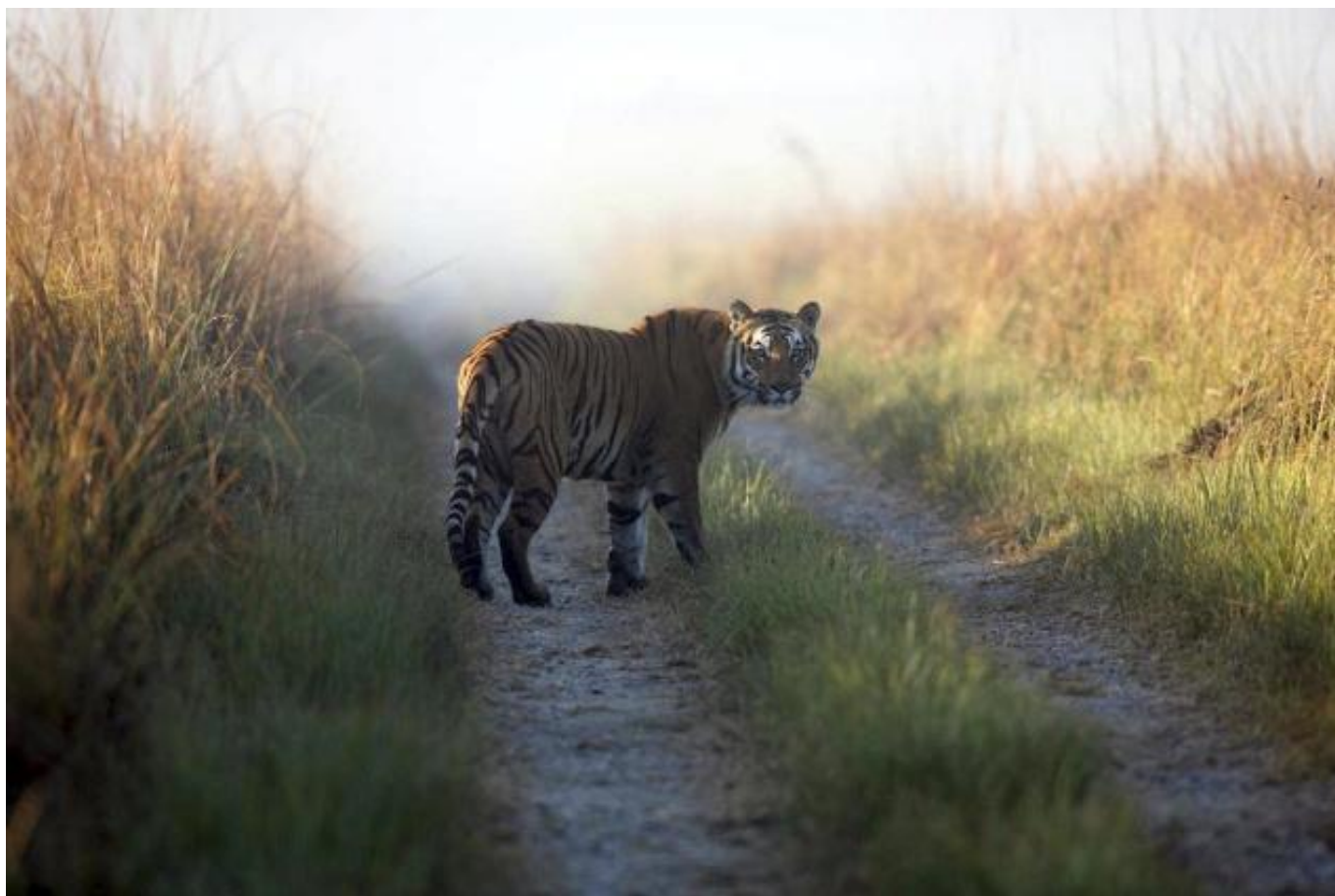
Corbett nationalpark

Bästa tid att påträffa Tiger: Tidigt på morgonen strax innan solen går upp eller vid solens nedgång