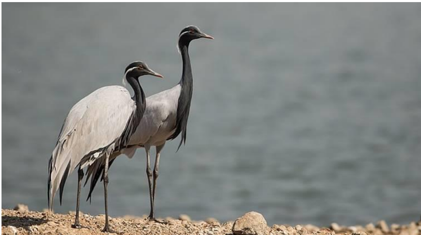
Demoiselle crane (jungfrutrana)