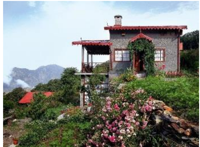
"foten av Himalaya"

Resan tar dig till två helt olika delar av Indien för fågelskådning: "Desert National Park" utanför ökenstaden Jaisalmer i landets västra utpost mot Pakistan, samt Nainitals omgivning vid foten av Himalaya i delstaten Uttarkand. Vi siktar även in oss på de stora katterna leopard och tiger under safaridagar på två olika platser.