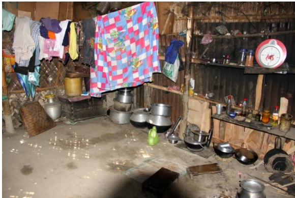
Interiör i en skolelevs bostad