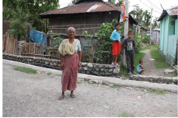
Bybor / bostäder i närområdet av skolan