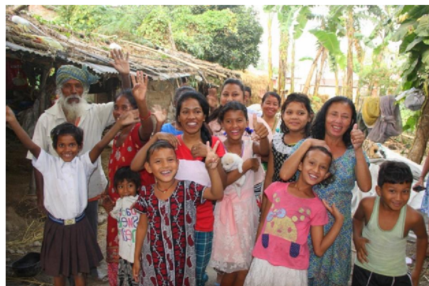
Besök hos befolkning i skolans närområde

SOM FADDER OCH SPONSOR UNDER 2017 HAR DU BIDRAGIT TILL ATT SPRIDA GLÄDJE OCH HOPP OM EN BÄTTRE FRAMTID FÖR FATTIGA BARN I BYN CHHOTA MECHYA BUSTY, JAIGAON INDIEN