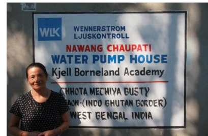
Pumphus och egen brunn ger skolan rent dricksvatten