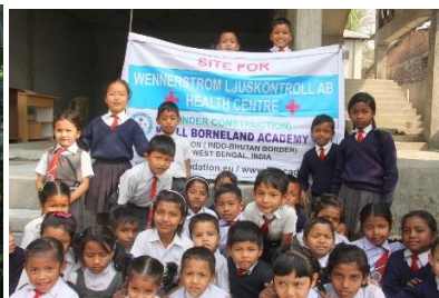
Ett "medical center" förbereds i den nya byggnaden