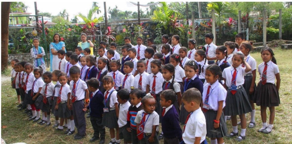
Skolbarn på Kjell Borneland Academy 2017