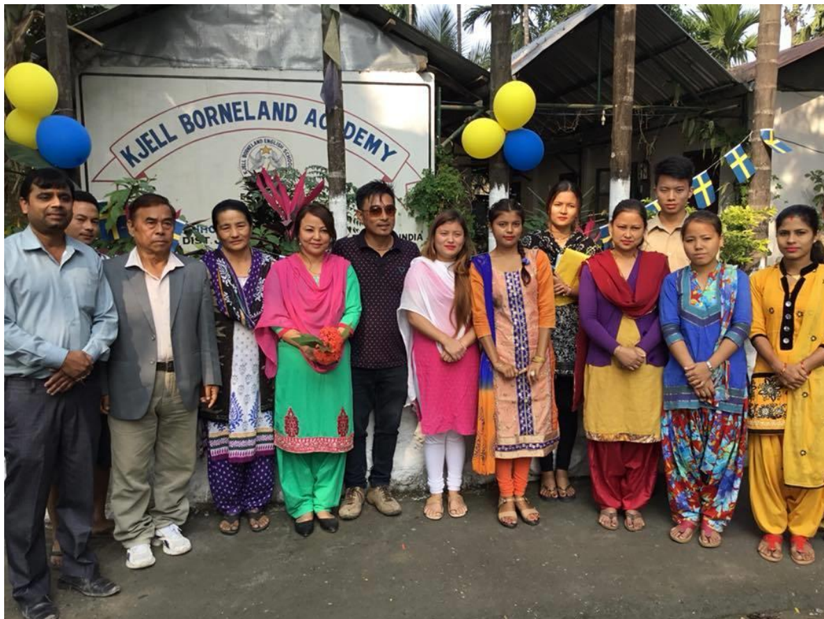
Grundare, rektor och lärare på Kjell Borneland Academy december 2017