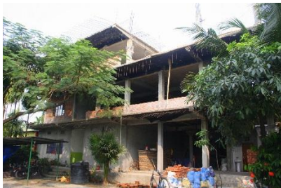
Den nya skolbyggnaden tar form

För att nå ut till fler familjer och få fler elever till Kjell Borneland Academy behövs duktiga och engagerade lärare, fler volontärer, sponsorer och en utökad fadderverksamhet. Målet är att fler barn i det fattiga närområdet skall kunna gå i skola istället för att arbeta i eller utanför hemmet eller vara utan sysselsättning. Då många familjer inte har egen förmåga att bekosta sina barns skolgång är vårt mål att ständigt utöka antalet faddrar. (kontakta oss gärna för information)