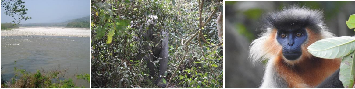
Manas Foto; Copyright Swed-Asia Travels