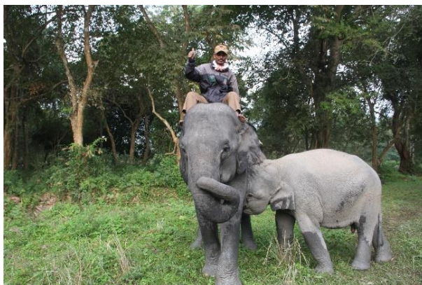
Kaziranga Foto; Copyright Swed-Asia Travels

Mycket tidig avresa från hotell Shanti Palace till den internationella flygplatsen. Flyg till Sverige.