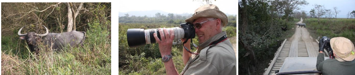
Kaziranga Foto; Copyright Swed-Asia Travels

I KAZIRANGA NATIONALPARK finns tiger, fläckig leopard, svart leopard (Panter) Sambar, Gaur, indisk vildhund, vilda bufflar, samt en mängd exotiska fåglar. Här finns bland annat fyra olika arter av näshornsfågeln. Den asiatiska elefanten är mindre än den afrikanska savannelefanten. Höjd skuldra; 2,45 – 2,75 cm/Vikt; 3000 kg/Ålder; ca 60 - 80 år.