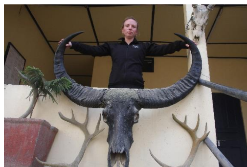
Kaziranga Foto; Copyright Swed-Asia Travels