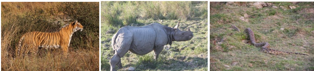
Kaziranga Foto; Copyright Swed-Asia Travels