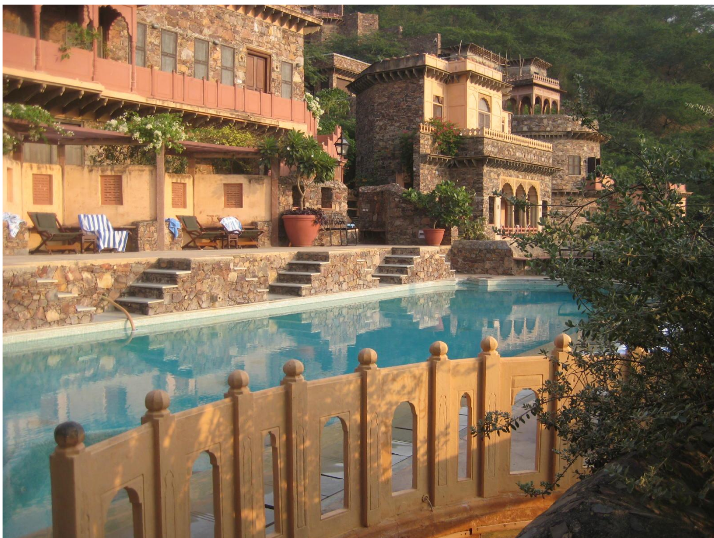
Neemrana Fort, Rajasthan Indien

Rajasthan är en av Indiens mest exotiska delstater med färgstarka inslag av turbaner, textilier och maharajaslott som för tankarna till "tusen och en natt". Delstaten kan beskrivas som ett land av prinsar och prinsessor, palats, påfåglar och beduiner. Väl där förstår du varför Rajasthan (kungarnas hemvist) har fått sitt namn. De många exotiska palatsen, forten och de muromgärdade städerna finns kvar och framkallar bilder från svunna tider. Rajasthans palats är arkitektoniska mästerverk och flera av dem är idag hotell. På några av dem bor du under denna resa, där du befinner dig i genuina miljöer från maharadjornas storhetstid.