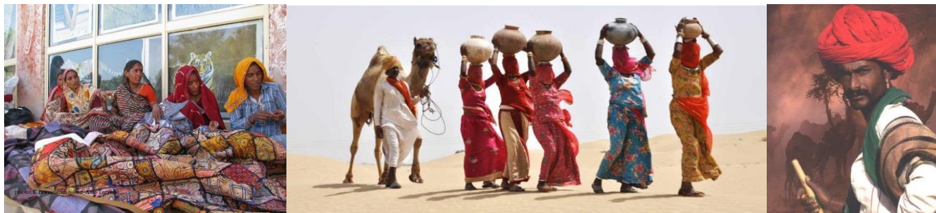
Rajasthan och dess stolta invånare