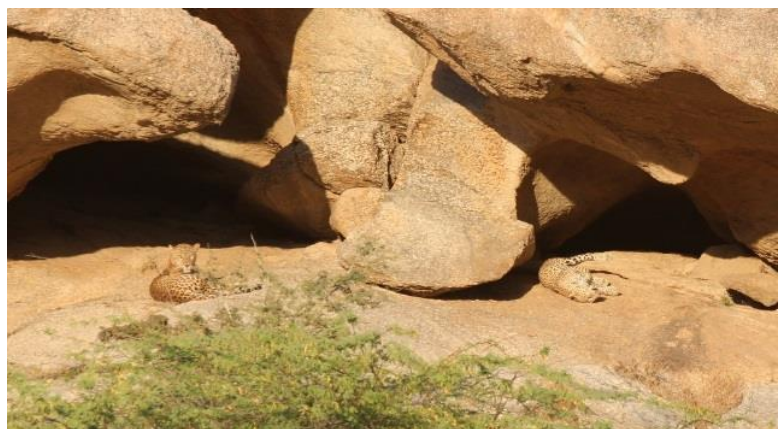
Leoparder i Bera