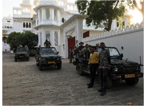
Välkommen till Beragarh Heritage