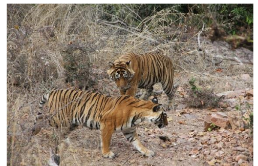
Ranthambhore Nationalpark

TIGERUNGAR; De flesta tigerungar föds efter regnperioden under november, en annan kull föds nästkommande år under april. Perioden när tigerhonan är dräktig är 102 till 105 dagar. Upp till sex ungar kan födas i intervaller under cirka två timmar med 10 till 15 minuters mellanrum. Honan tvättar omgående sina ungar genom att slicka dem torra, det sägs att tiger är ett av de renaste djur som finns.