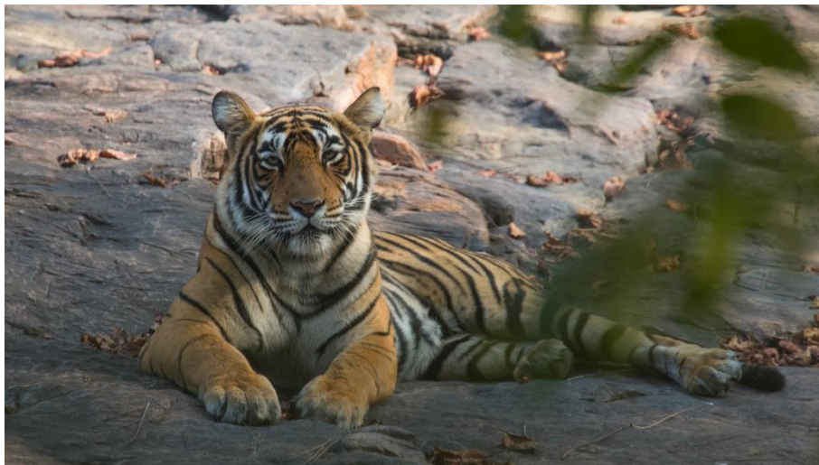
T28 MALE -TIGER ZON NR 3 RANTHAMBHORE NATIONALPARK - FOTO OWE WESTMAN 2022

Rajputerna (befolkningen i Rajasthan) var historiskt sett ryktbara för sin ridderlighet och sin enorma tapperhet. Med en stark känsla av ära (jämför samurajer i Japan) föredrog de döden framför kapitulation. I hopplösa lägen begick man ett sorts rituellt kollektivt självmord kallat " jauhar " där kvinnorna kastade sig själva på bål medan männen iförda den saffransfärgade turbanen red ut mot den övermäktiga fienden och därmed en säker död. Stolthet och mod är det genomgående temat i alla berättelser och sägner om det ståtliga krigarfolket Rajputs.