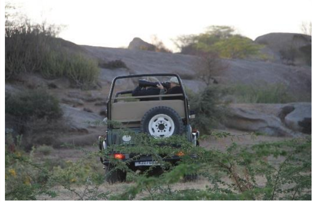
Leopardsafari med Kjell och Deepak i Bera