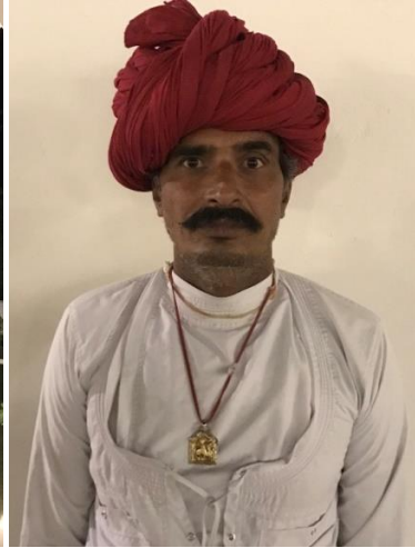
Trotjänare på slottet