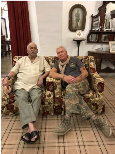
Maharadjan of Beragarh Heritage