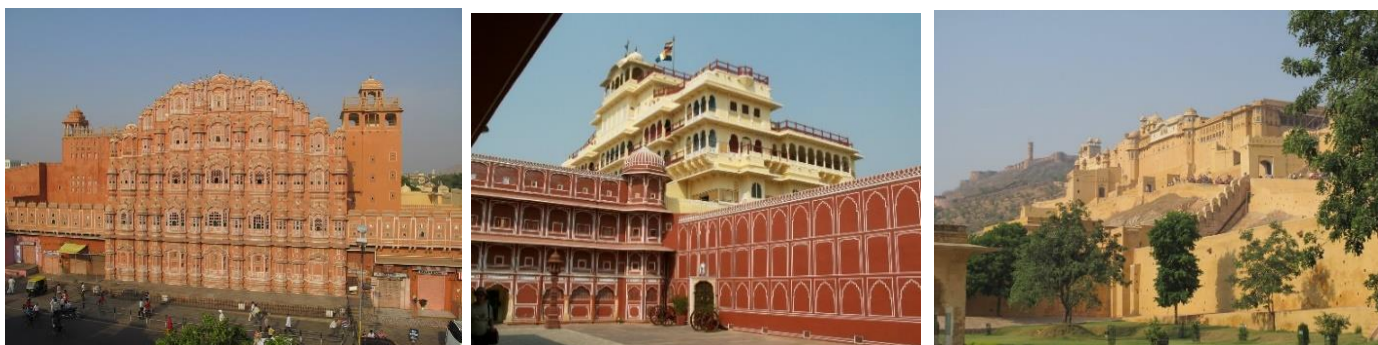
Foton Vindarnas palats, City Palace, Amber fort, Jaipur - Copyright Swed-Asia Travels