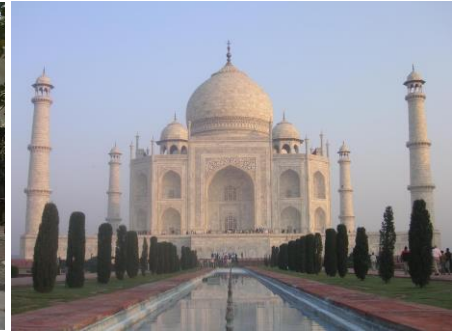
Taj mahal, Agra