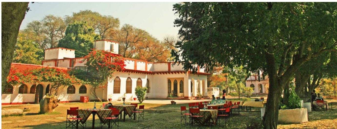
CHAMBAL SAFARI LODGE – VÅR LUNCH SERVERAS I TRÄDGÅRDEN

Omgivningen är ett sällsynt paradiset för fågelskådare och för den som har intresse av reptiler. På floden som flyter fram i Chambal genomför ni en kort båtutflykt (3 timmar) för att fotografera, njuta av eller beundra exotiska fåglar, sötvattenkrokodiler, den utrotningshotade gavialen, ödlor, sköldpaddor och sötvatten-delfiner.