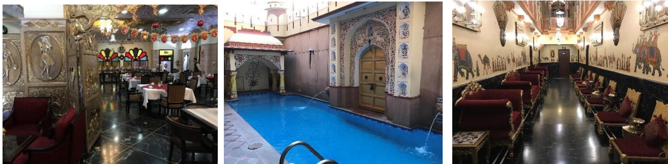
Foton hotel Umaid Mahal, Jaipur