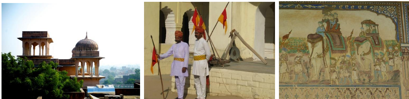
Foton Mandawa