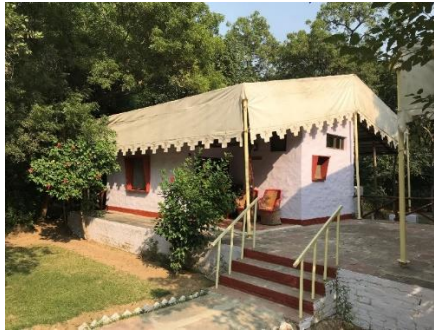
rum på Chambal Safari Lodge