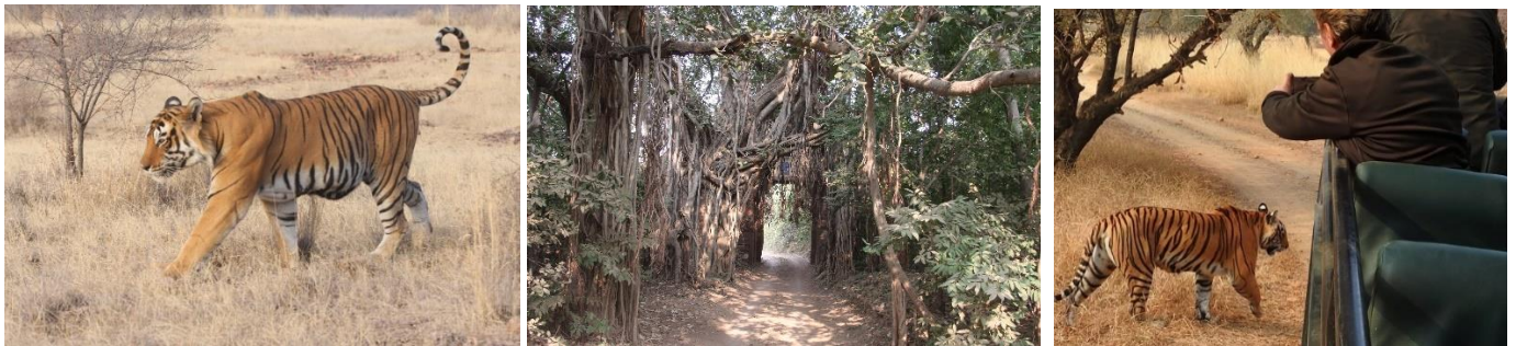
Foton Ranthambhore

RANTHAMBHORE NATIONALPARK: I Indien finns 54 tigerreservat, 500 naturreservat och 115 naturvårdsområden. Ingen annan varelse i Indiens natur är mer mytomspunnen än den Bengaliska Tigern, den vackra katten är inte bara en symbol för skönhet och styrka, den är även lika fruktad för sina fasansfulla överfall. Kring sekelskiftet fanns ca 40 000 tigrar i Indien. Vid början av 70-talet hade antalet vilda tigrar i Indien krympt till knappt 2 000 individer. Vid den senaste tigerräkningen 2023 hade antalet tigrar ökat till 3 682, förmodligen finns det fler.