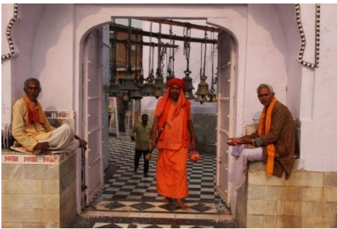
Tempelområdet vid floden Yamuna