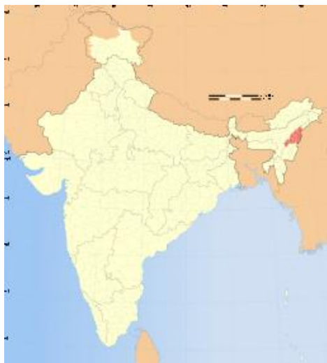
Rödmarkerad delstat Nagaland