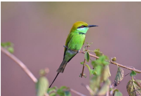
Större Näshornsfågel ( Buceros bicornis ) – Grön Biätare ( Merops persicus ) Assam och Nagaland