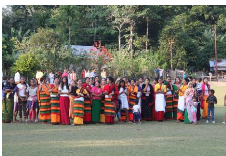
Byborna i Gidingpur