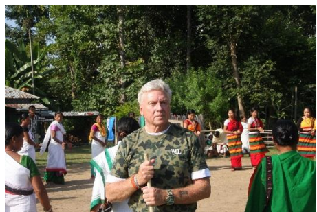
Besök i Gidingpur