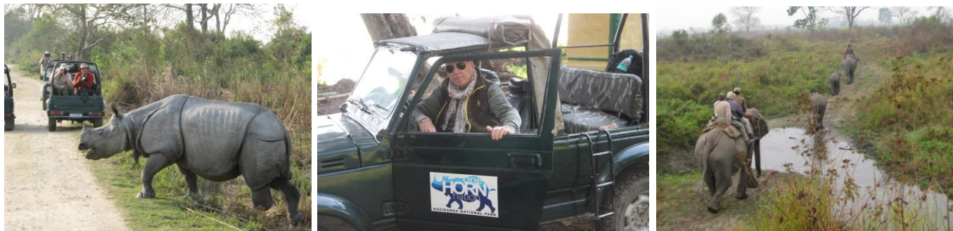
Foto Kaziranga nationalpark

KAZIRANGA NATIONAL PARK har utöver sina 2 000 enhornade noshörningar även en stor population av vilda elefanter. I nationalparken finns; Tiger, fläckig leopard, svart leopard (Panter) Sambar, Gaur, indisk vildhund, vilda bufflar, liksom mängder av tropiska fåglar inklusive fyra olika arter av näshorns fågeln. Den asiatiska elefanten är mindre än den afrikanska savannelefanten. Höjd på skuldror; 2,45 – 2,75 m/Vikt; 3000 kg/Ålder; ca 60 - 80 år.