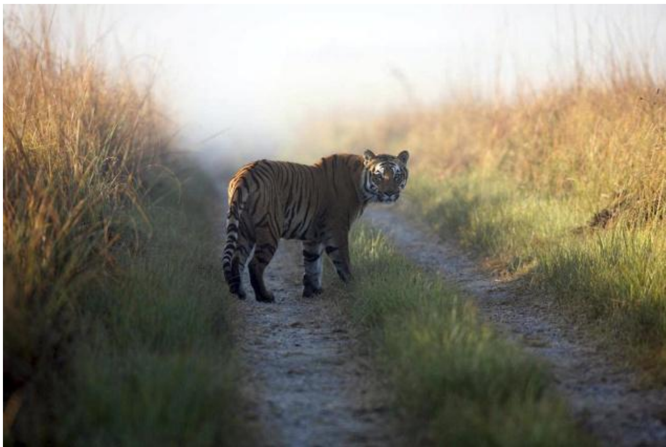
Corbett nationalpark

Bästa tid att påträffa Tiger: Tidigt på morgonen strax innan solen går upp eller vid solens nedgång