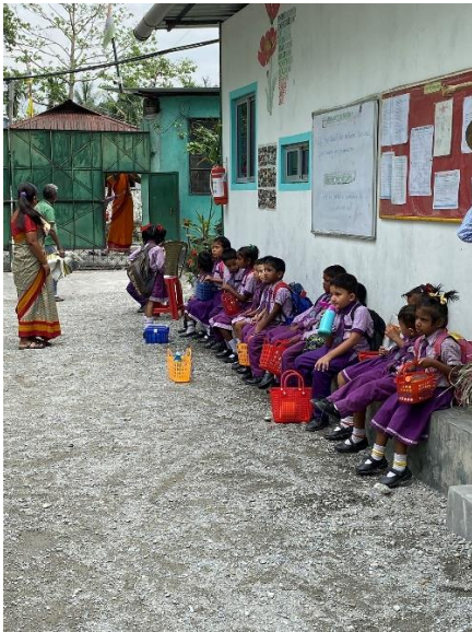
Elever väntar efter skoldagen på att bli upphämtade av anhöriga.