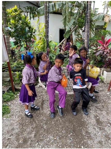
Rast och lek