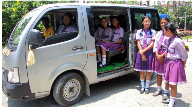
Alldeles nyinköpt skolbuss provas av elever.