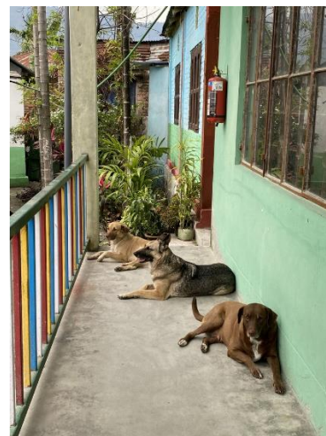
Nattetid är dessa tre hundar effektiva vakthundar på skolområdet.