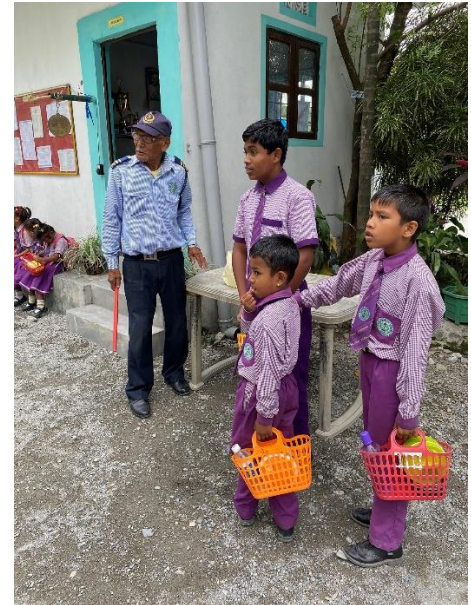
I korgarna på bilden har elever med sig skollunch hemifrån

På skolor i Indien ingår aldrig skollunch. De familjer som har förmåga skickar med sina barn "en måltid". Det kan vara allt från kex och popcorn, till att i bästa fall vara lagad mat som ris och grönsaker. Många av skolans elever har inte med någon egen lunch. Vissa elever med särskilt svåra hemförhållanden står därför under "rektorsparets beskydd" och tilldelas ett mål vällagad mat, helt ideellt. Här kan fler vara med och göra skillnad. Bidrag till skolans matprojekt för de fattigaste elevena välkomnas! Under året som gått har flera av eleverna nu kunnat tilldelas skolmat tack vare era bidrag.