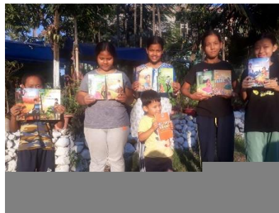
litteratur till skolbiblioteket