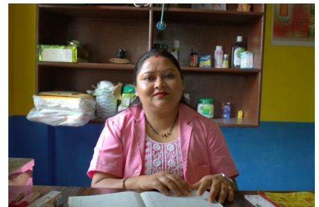
genomgång med skolsköterskan