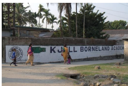
Vägen fram till skolan